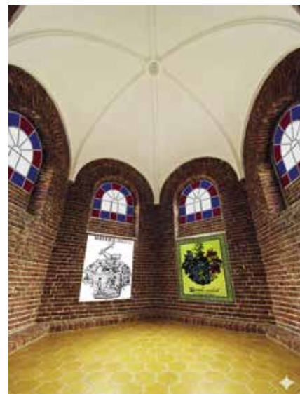
► A mauzóleum belseje – helyreállítási terv